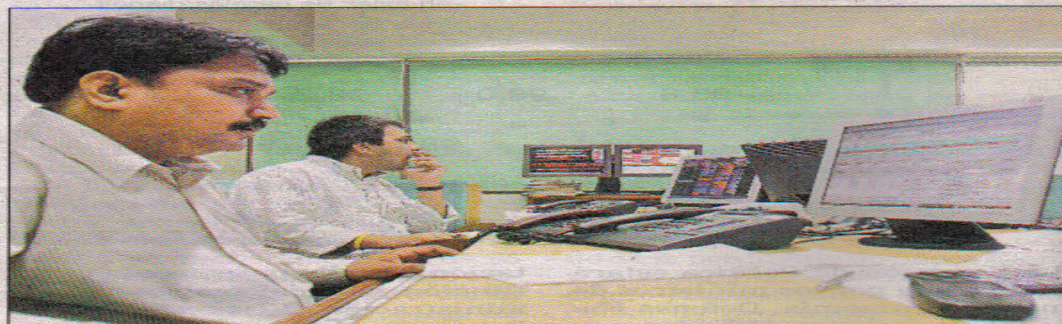
INVERSIONISTAS INDIOS MIRAN LA FLUCTUACIÓN DE LAS MONEDAS, A TRAVÉS DE SUS COMPUTADORAS. A ESTAS PERSONAS SE LOS CONOCE COMO DEALERS

permite jugar e invertir el dinero a cualquier hora del día. Es una adicción y un buen negocio si se lo hace bien. Hay que saber comprar y vender en el momento indicado. De cada $1 000 invertidos se puede ganar hasta $100 mil. Cualquiera puede participar, la idea es asociarse a un buen corredor que maneje la cuenta del usuario, porque también hay estafadores", señala Palacios.