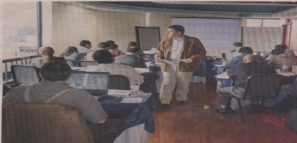
La operación Forex se semeja a la que se realiza en las bolsas de Valores, pero está abierta a todos.